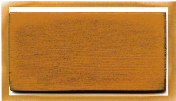
темный орегон dark oregon pine 809

Материалы по древесине (сосна) атмосферостойкие, светостойкие для окраски фасадов и оконных блоков.