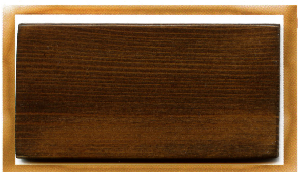
орех walnut 812