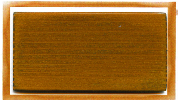
дуб серебристый silver oak 813