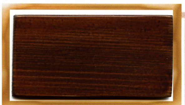
каштан chestnut 815