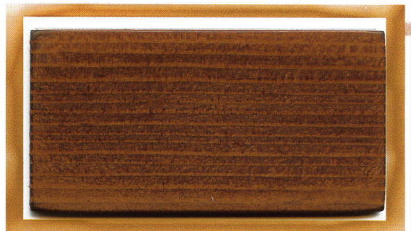
палисандр rosewood 814