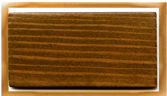
тик teak 811