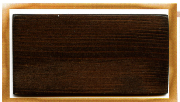
чернотал bay-leaf willow 816